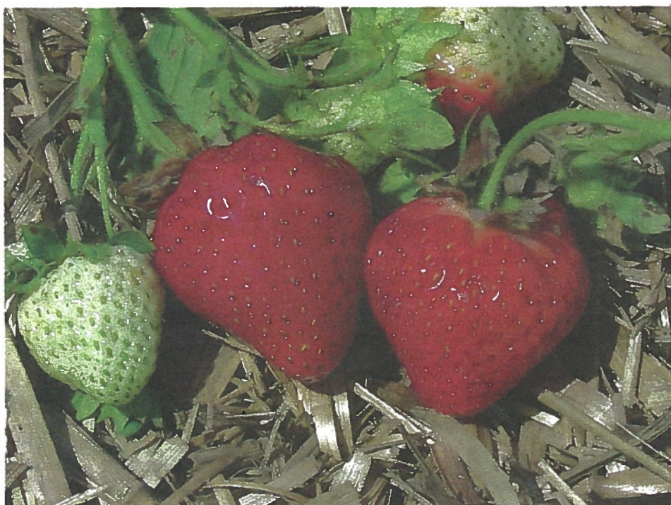
La Clé des champs est d'un rouge clair brillant, et sa chair rouge orangé est ferme.

De plus, les fraises se conservent longtemps (jusqu'à cinq jours à la température de la pièce). Enfin, les plants sont très résistants aux maladies foliaires et aux